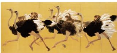
平子真理《Monkey Race》(左隻) 2010年

「鳥獣戯画」の世界を再解釈した「現代鳥獣戯画」を中心に、動物たちの豊かな表情や動きを、伝統的な日本画の技法で描いた様々な動物画をご紹介します。古典の題目に現代の感性が融合して生まれた新しい「鳥獣戯画」の世界を、ぜひご堪能下さい。