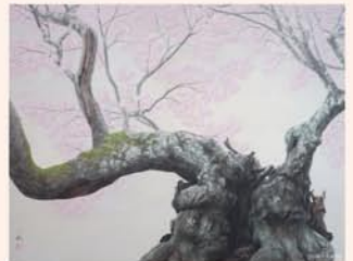
押元一敏《山高神代桜》2022年