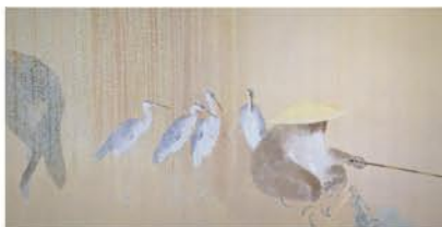
竹内浩一《戯画釣名人》2009年

「鳥獣戯画」の世界を再解釈した「現代鳥獣戯画」を中心に、動物たちの豊かな表情や動きを、伝統的な日本画の技法で描いた様々な動物画をご紹介します。古典の題目に現代の感性が融合して生まれた新しい「鳥獣戯画」の世界を、ぜひご堪能下さい。