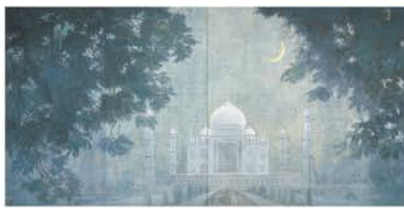
西田俊英《星夜燦々》2001年

建築は、土・木・石・金属など多様な素材を用いて世界各地でさまざまな形態で築かれています。実用性のみならず、歴史や形態の美しさといった多面的な魅力を持つ建築は、絵画においても伝統的なモチーフとして数多く制作されてきました。本展では、国内外の様々な建築に着目して制作された大迫力の現代日本画を展覧いたします。現代日本画ならではの繊細な表現を通して見られる様々な建築美をどうぞご堪能ください。