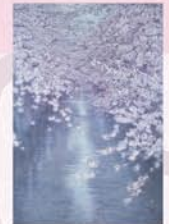
伊達良《さくら川》2013年